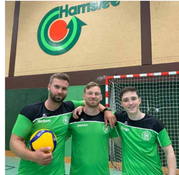
„Die drei vom Süderholm – dabei seit 2024“

Wenn man Volleyball spielen will, ist eine angenehme und friedliche Stimmung immer am besten. Und als ich in den Volleyballverein vom TSV Nord gekommen bin, war eins klar: hier lässt sich's aushalten. Mit einer nicht vergleichbaren Vorfreude fiebert man hier jede Woche immer wieder aufs Neue dem Dienstag entgegen. Mit einer großen Anzahl an Mitspielern und meist auf zwei Feldern wird einem auch alles andere als langweilig, obwohl der Fokus ganz klar mehr auf Spielspaß und Freude liegt, als auf knallhartem Gewinnen.