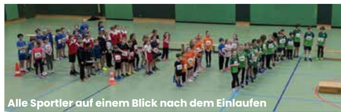
Alle Sportler auf einem Blick nach dem Einlaufen

Seit den Osterferien findet man uns bei (fast) jedem Wetter draußen auf dem Sportplatz. Bis Ende Juni waren wir bei den Kreismeisterschaften im Einzel und im Mehrkampf am Start sowie zum ersten Mal überhaupt bei einem Werferabend.