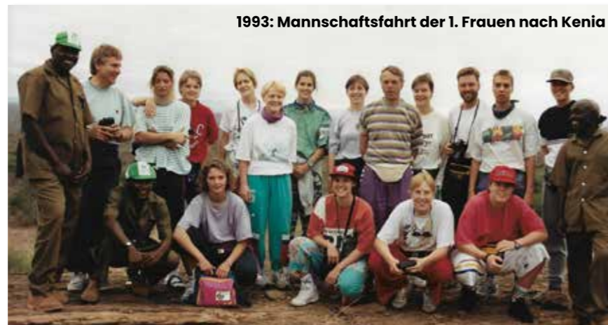
1993: Mannschaftsfahrt der 1. Frauen nach Kenia

Wir wünschen Dir ganz viel Erfolg für die Zukunft – sowohl privat als auch sportlich und freuen uns, wenn wir Dich noch ganz lange am Holmberg begrüßen dürfen!!!