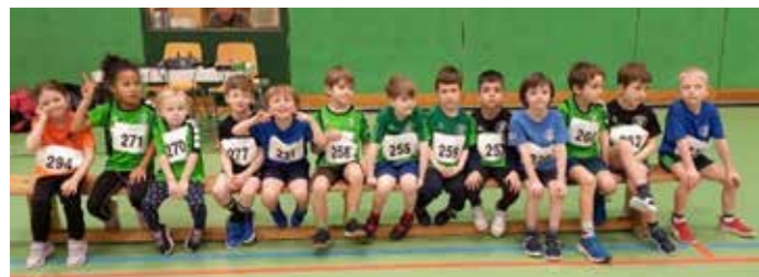
Die Jüngsten warten beim Weitsprung

So gerne wir auch Gastgeber sind – die Medaillen behalten wir gerne hier. Insgesamt 19 Medaillen wurden von den Kindern aus Harrislee geholt, was Platz 1